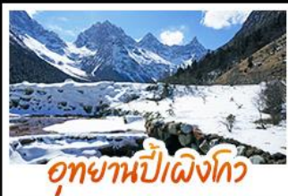
อุทยานปีศาจโกว

หมีแพนด้าอนุเชลฟี • สะพานโบราณหนานเฉียว • ภูเขาหิมะวาวู เมืองโบราณกวนเซี่ย • อุทยานปีศาจโกว • อุทยานต้ากู่ปิงชว่น ยอดเขาง้อไบ๊ • วัดเป่ากั๋ว • ล่องเรือชมมรดกโลกหลวงพ่โตเล่อซาน วัดต้าเฉียว • ถนนไท่กู่หลี่ • ถนนชุนชี่ตู้ • ถนนโบราณชอยกว้างชอยแคบ