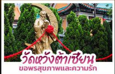
วัดหวังต้าเซียน ขอพรสุขภาพและความรัก

ขอพรเจ้าแม่กวนอิมวัดซีซาน ที่สูงเป็นอันดับ 2 ของโลก นั่งกระเช้าเองปีงสักการะพระใหญ่เทียนถาน • ขอพรองค์แซง โชคลาภ การเงินและธุรกิจ • ซ็องปีงจู่ใจย่านจิมซาจุ่ย และ CITYGATE OUTLETS