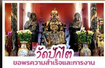
วัดบักโต ขอพรความสำเร็จและการทำงาน