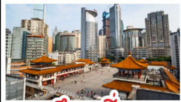
ตึกขุยซิง