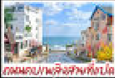
สิงคโปร์