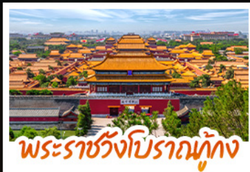
พระราชวังโบราณทั้กง