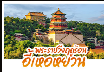
พระราชวังฤดูร้อน ฮ้อเจอเฉยวัน