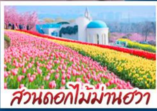
สวนดอกไม้บ้านฮวา