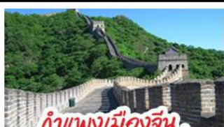
กำแพงเมืองจีน ด่านมู่เทียนยวี่

Universal Beijing - กำแพงเมืองจีนด่านมู่เทียนยวี่ (รวมกระเช้าขึ้น-ลง) พระราชวังโบราณกู้กง - หอฟ้าเทียนถาน - ซุปป์ิงถนนหวิงฝูจิ่ง และซานหลี่กุน เมนูพิเศษ สุกิมองโก, เป็ดปักกิ่ง, Michelin Guide ร้าน Tao Tao Ju