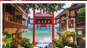
หมู่บ้านโบราณฉือซีโจว