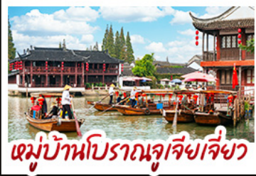
หมู่บ้านโบราณจูเจียเจี๋ย