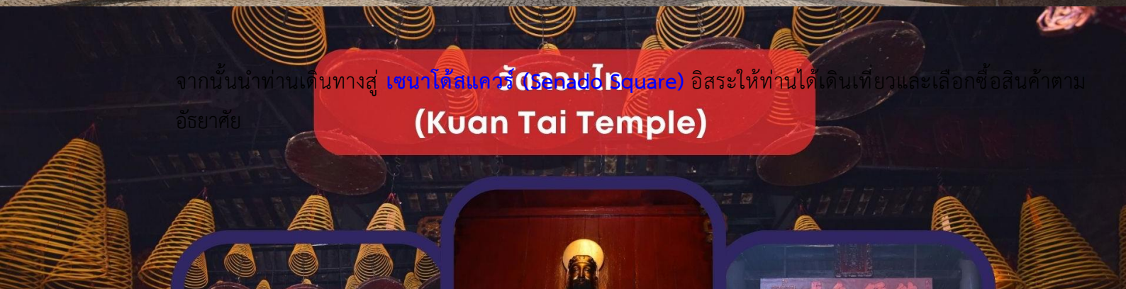
วัดกวนไต๋ (Kuan Tai Temple)

จากนั้นนำท่านเดินทางสู่ เซนาโดสแควร์ (Senado Square) อิสระให้ท่านได้เดินเที่ยวและเลือกซื้อสินค้าตามอัธยาศัย