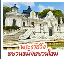
พระราชวัง เซวณเหมิงเซวณใหม่