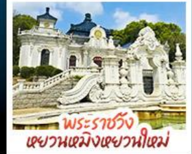
พระราชวังเซวานเมิงเซวานนิเม