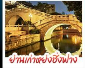
ย่านเก่าแห่งซิงฟาง