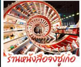
ร้านหนังสือจุงซูเกอ