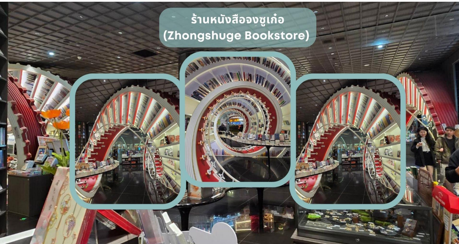
ร้านหนังสือจงซูเกอ (Zhongshuge Bookstore)

นำท่านเดินทางสู่ เมืองเซินเจิ้น เมืองเศรษฐกิจพิเศษแห่งแรกของประเทศจีน และหนึ่งในมหานครที่มีการพัฒนาอย่างรวดเร็วที่สุดในโลก จากอดีตที่เคยเป็นเพียงหมู่บ้านชาวประมงเล็ก ๆ ริมชายฝั่งทางตอนใต้ของจีน ปัจจุบันได้เติบโตขึ้นเป็นศูนย์กลางด้านเศรษฐกิจ การค้า การลงทุน เทคโนโลยี และนวัตกรรมที่สำคัญของประเทศจีนและระดับโลก เซินเจิ้นได้รับการขนานนามว่าเป็น “ซิลิคอนวัลเลย์แห่งจีน” เนื่องจากเป็นที่ตั้งของบริษัทเทคโนโลยีชั้นนำระดับโลกมากมาย และเป็นศูนย์กลางการวิจัย พัฒนา และผลิตนวัตกรรมสมัยใหม่ ทำให้เมืองแห่งนี้เต็มไปด้วยความทันสมัย อาคารสถาปัตยกรรมล้ำสมัย ระบบคมนาคมอันมีประสิทธิภาพ และคุณภาพชีวิตที่ได้รับการพัฒนาอย่างต่อเนื่อง