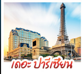
เดอะ ปารีส

สัมผัสบรรยากาศ เดอะ เวเนเซียน มาเก๊า เสมือนได้เยือนลาสเวกัส ชมความวิจิตรตระการตาของพระราชวังหยวนหมิงหยวนใหม่แห่งจูไห่ เช็กอินกับแลนด์มาร์กสุดฮิตจตุรัสสวาเอ็งถ่ายรูปแบบทิวทัศน์ของกวางเจา เที่ยวชมหมู่บ้านสไตล์ยุโรปแห่งใหม่ของเซินเจิน • ช้อปปิ้งเพลิน ๆ ที่ ห้างสรรพสินค้า COCO PARK ถนนคนเดินฟู้หัวหลี่และถนนคนเดินปิกกิง