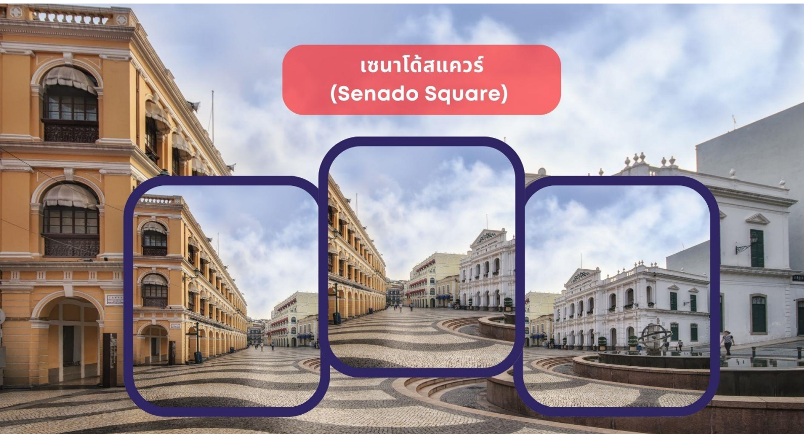
เซนาโดสแควร์ (Senado Square)

นำท่านชม วิหารเซนต์ปอล (Ruins of St. Paul's) โบสถ์แห่งนี้เคยเป็นส่วนหนึ่งของวิทยาลัยเซนต์ปอล ซึ่งก่อตั้งในปี ค.ศ. 1594 และปิดไปในปี ค.ศ. 1762 และเป็นมหาวิทยาลัยตามแบบตะวันตกแห่งแรกของเอเชียตะวันออกเฉียงใต้ โบสถ์เซนต์ปอลสร้างขึ้นในปี ค.ศ. 1580 แต่ถูกทำลายถึงสองครั้ง ในปี ค.ศ.1595 และ ค.ศ.1601 ตามลำดับ จนกระทั่งเกิดเพลิงไหม้ในปี ค.ศ. 1835 ทั้งวิทยาลัย และโบสถ์ถูกทำลายจนเหลือแต่ด้านหน้าของตึกฐานโบสถ์ส่วนใหญ่และบันไดด้านหน้าของตึกแสดงให้เห็นถึงสไตล์ผสมระหว่างตะวันออกและตะวันตกและมีอยู่ที่นี่เพียงแห่งเดียวเท่านั้นในโลก