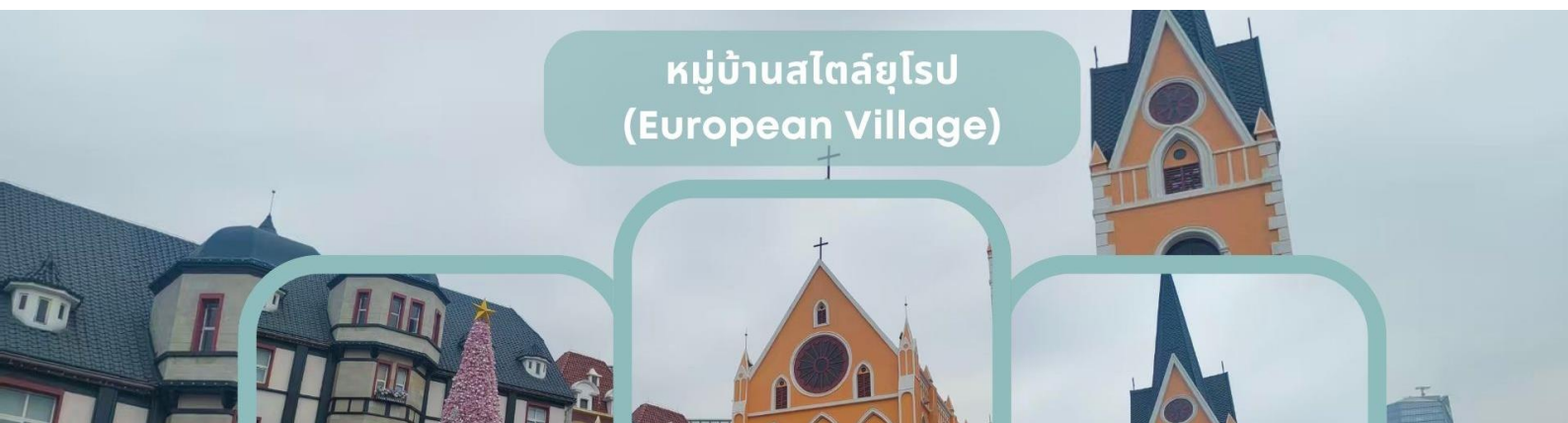
หมู่บ้านสไตล์ยุโรป (European Village)

นำท่านแวะถ่ายรูปที่ ร้านหนังสือจงซูเกอ (Zhongshuge Bookstore) ร้านหนังสือชื่อดังที่ได้รับการยกย่องให้เป็นหนึ่งในร้านหนังสือที่สวยงามที่สุดของเมืองเซินเจิ้น ตั้งอยู่ภายในศูนย์การค้า OH Bay Mall โดดเด่นด้วยการออกแบบสไตล์โมเดิร์นผสมผสานงานศิลปะร่วมสมัยได้อย่างลงตัว ภายในตกแต่งด้วยชั้นวางหนังสือรูปทรงโค้งและเกลียวที่เชื่อมต่อกันอย่างสร้างสรรค์ ให้ความรู้สึกราวกับกำลังเดินอยู่ในแกลเลอรีศิลปะสุดล้ำ อิสระให้ท่านเก็บภาพความประทับใจกับมุมถ่ายรูปสุดชิคที่ได้รับความนิยมจากนักท่องเที่ยวและสายคอนเทนต์ พร้อมเลือกชมหนังสือ ของที่ระลึก และสินค้าต่าง ๆ ภายในร้าน ท่ามกลางบรรยากาศอันสวยงามและมีเอกลักษณ์ที่ไม่ควรพลาดเมื่อมาเยือนเมืองเซินเจิ้น