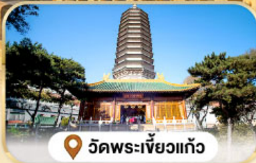
วัดพระเจี๋ยกั๋ว