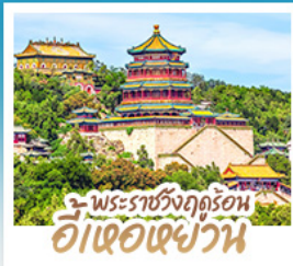
พระราชวังฤดูร้อน อี่เซ่อเฉียวาน

ทริปเดียวเที่ยว 2 เมือง ปักกิ่ง-ต้าเหลียน • เที่ยวจีนฟีลยุโรป ณ เมืองเวนิสแห่งต้าเหลียน • สัมผัสประสบการณ์ขึ้นกำแพงเมืองจีน ด่านจวิ๊ยกกวน • ซ้อป ซิม ซิล ที่ถนนโบราณตงกวนและย่านซานหลี่ถู่