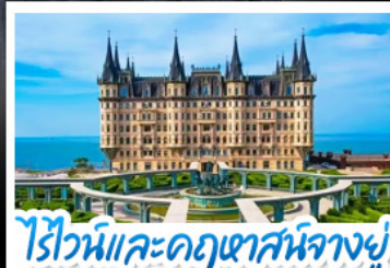
ไรไวน์และคฤหาสน์นางยู