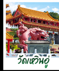
วัดเหวินอู๋