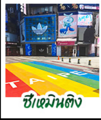
ซีเหมินดิง

สัมผัสสมท้แห่งเกาะฟอร์โมซา • ล่องเรือสุริยันจันทร์ ทะเลสาบที่สวยงามแห่งหนึ่งของไต้หวัน เกาะลาลู • วัดเหวินอู๋ วัดศักดิ์สิทธิ์ริมทะเลสาบ • สักการะพระอัฐิพระกัซซังจั้ง • ชิมขนมพายฮับโปรด ของฝากยอดนิยม • อนุสรณ์สถานเจียงไคเช็ค แลนด์มาร์กทางประวัติศาสตร์ • ชิเหมินดิง ยำช้อปปิ้งสุดฮิต จิวเฟิ่น หมู่บ้านโบราณโคมแดง บรรยากาศสุดคลาสสิก • ลีอเฟิ่น ปล่อยโคมลอย • ไทเป 101 ตึกระฟ้า สัญลักษณ์แห่งความทันสมัย • จงชาน ย่านคาเฟ่และไลฟ์สไตล์สุดฮิป • วัดหลงชาน วัดเก่าแก่ เสริมสิริมงคล