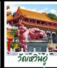
วัดเหวินอู๋