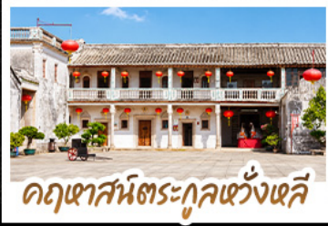
คฤหาสน์ตระกูลเซ่งเจ๋อ