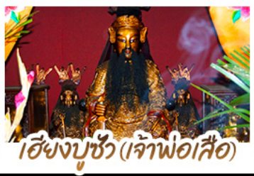
เฮียงบู้ซัว (เจ้าพ่อเสือ)