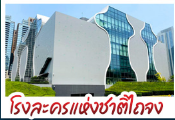
โรงละครแห่งชาติไทเป

รถไฟอาลีซาน - ล่องเรือสุริยันเจ็ทรา ตึกTaipei 101 - โรงละครแห่งชาติไทเป ซีเหมินติง - อนุสรณ์สถานเจียงไคเช็ค