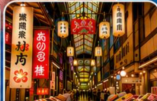
ตลาดปลานิชิกิ