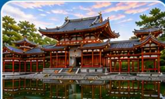
วัดเบียวโดอิน