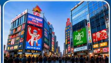
ช้อปปิ้งย่านชินไซบาชิ