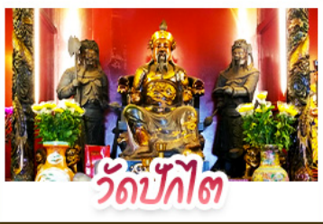
วัดปักไต้