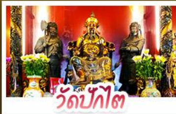
วัดปักโก๊ต