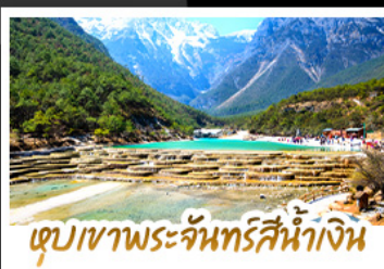
เขื่อนเขาพระจันทร์สีน้ำเงิน