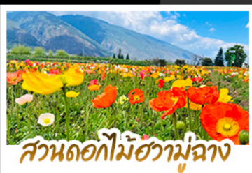
สวนดอกไม้ฮาวามูตาง