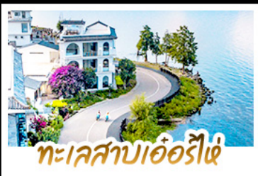
ทะเลสาบเออร์ไฮ

นั่งรถม้าสุดฟิน ชมทุ่งข้าวสีทองเหลืองอร่าม • ถ่ายรูป MOOD ที่ใช้กับวิวทะเลสาบเออร์ไฮสุดโรแมนติก ชมดอกไม้ตามฤดูกาลกลางขุนเขา ณ สวนอวามูตาง • พิชิตภูเขาหิมะมังกรหยกความสูงกว่า 4,506 เมตร (รวมกระเช้าใหญ่ ไป-กลับ) • นั่งรถไฟชมวิวภูเขาหิมะมังกรหยกวิวพาโนรามา • จิบกาแฟยามบ่าย พร้อมจิบช็อคอิน วิวหลักล้าน ณ ร้านกาแฟพายุหิมะ (รวมค่าเครื่องดื่มท่านละ 1 แก้ว) • เที่ยวเมืองโบราณต้าหลี่ ลีเจีย ไปซา ชิม ซ้อป แชะ กับวัฒนธรรมยูนนาน • ซ้อปปิ้งเพลิน ณ ถนนคนเดินหนานผิงเจียและ POP MART