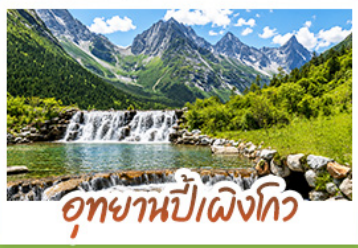
อุทยานปี่เฉิงโกว