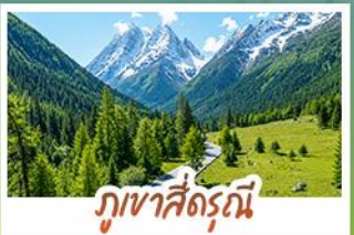
กุหลาบสี่ดรุณี