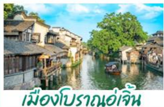
เมืองโบราณอู๋เจิน