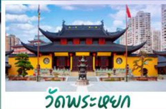
วัดพระหยก