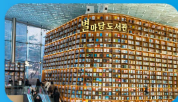
ห้องสมุดสตาร์ฟิลา

เก็บทุกไฮไลท์ ในกรุงโซล ตั้งแต่ความงดงามของ พระราชวังเคียงบ็อก ชมวิวสุดอลังการที่ ตึกลิอิตเต้ โซลสกาย (รวมค่าลิฟต์ขึ้นตึก) สนุกสุดมันส์ที่ สวนสนุกลิอิตเต้ เวิร์ล (รวมค่าบัตรเครื่องเล่น) เพลิดเพลินไปกับโลกใต้ทะเล ล้อตเต้ อควาเรียม (รวมค่าบัตรเข้าชม) เช็กอินแลนด์มาร์กสุดฮิตอย่างห้องสมุดสตาร์ฟิลา โคเอกมอลล์ เดินเล่นย่านฮิป บรูกลินเกาหลี ชองซูคัง และช้อปปิ้งซัมเมอร์เซล สุดฟิน ย่านเมืองคังและงาแด