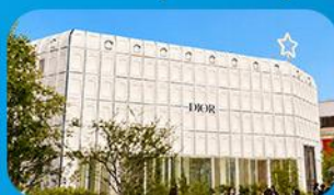
บรูกลินเกาหลี