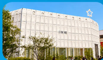
บรูกลินเกาหลี