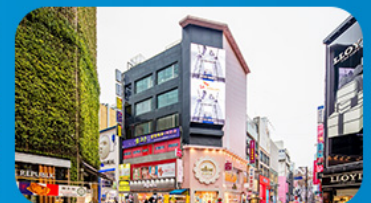
ช้อปปิ้งย่านเมียงดง