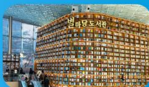
ห้องสมุดสตาร์ฟิล