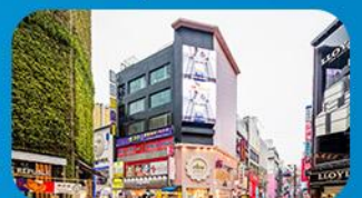
ช้อปปิ้งย่านเมียงดง