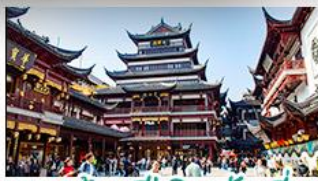
ตลาดร้อยปีเจิ้งหวงเหมียว