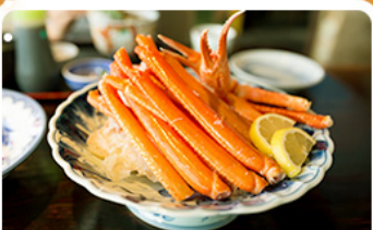
พิเศษ! ขาปู