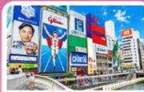
ชินโซนาชิ