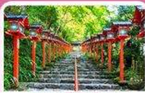
ศาลเจ้าคิฟูนะ