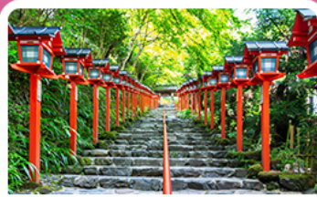
ศาลเจ้าคิฟูเนะ