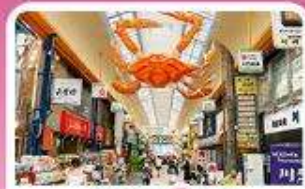
ตลาดคูกุโรมง

เดินทาง 03 - 07 ก.ค. 69 | 19 - 23 ส.ค. 69 | 25 - 29 ก.ย. 69