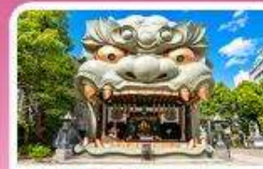
ศาลเจ้านัมมะ ยาชากะ