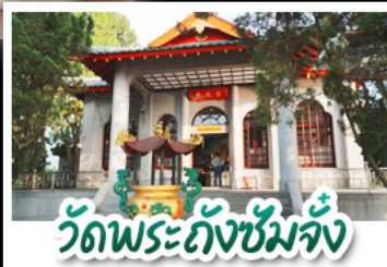
วัดพระถังซัมจั๋ง