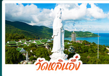
วัดเข็กนั้ง