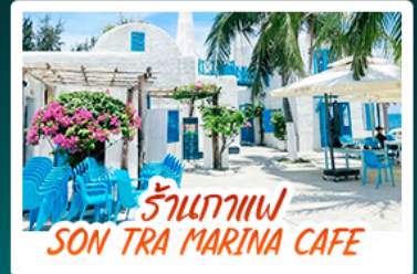
ร้านกาแฟ SON TRA MARINA CAFE