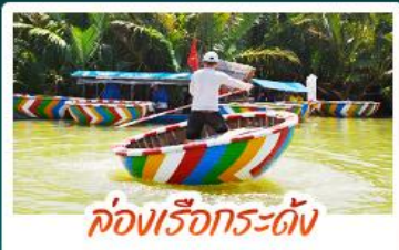
ล่องเรือกระทง