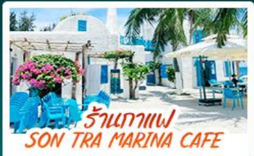
ร้านกาแฟ SON TRA MARINA CAFE