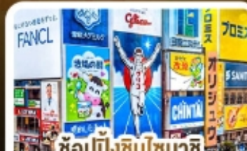
ช้อปปิ้งชินโซบาชิ และโดตงโมริ