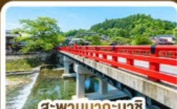
สะพานนาคะบาชิ ทาคายาม่า