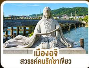
เมืองอูจิ สวรรค์คนรักชาเขียว