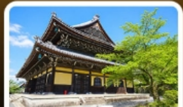
วัดนันเซ็นจิ