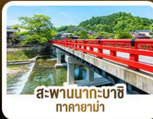
สะพานนากะบาชิ ทาคายาม่า