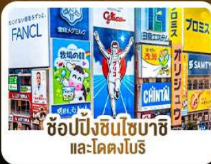
ช้อปปิ้งชินไซบาชิ และโดตงโมริ