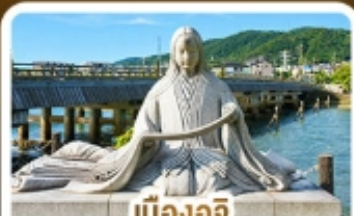
เมืองอิจิ สวรรค์คนรักชาเขียว