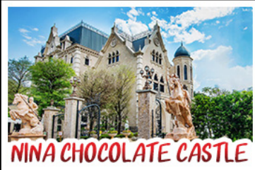
NINA CHOCOLATE CASTLE

ทะเลสาบสุริยันจันทรา - ไทเป 101 จิวเฟิ่น - NINA CHOCOLATE CASTLE MONSTER VILLAGE - ชิเหมินตง เมนูพิเศษ ปลาประจานาธิบดี เซี่ยวหลงเปา / ชาบูไต้หวัน