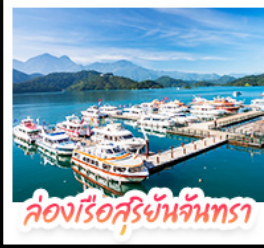
ล่องเรือสุริยันจันทรา

ล่องเรือชมทะเลสาบสุริยันจันทรา (SUN MOON LAKE) ชมเกาะลาลู แวง-วัดสวนทอง • อิสระเดินเล่น หมู่บ้านอิ๋ต๋าเซ่า • นั่งรถไฟเล็กโบราณ (1 สถานี) สัมผัสบรรยากาศเส้นทางรถไฟสายธรรมชาติ • ตะลุย ไทจงโมก้ามาร์เก็ต แหล่งรวมแฟชั่นและสตรีทฟู้ด • ซุปป์นึ่งย่าน ซิเหมินตง (XIMENDING) ถ่ายรูปแลนด์มาร์ค ตึกไทเป 101 • ช้อปปิ้งที่ Mitsui Outlet Park ชมความสวยงามของ อนุสรณ์สถานเจียงไคเช็ค • หอพระความรักที่ วัดหลงซาน ชมโศกหินเศียรราชินีที่ เย่หลิว • ชมบรรยากาศเมืองเก่าที่ จิวเฟิน