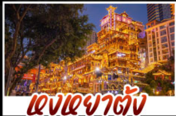
แสงอาคารต่าง

สัมผัสประสบการณ์เที่ยวจีนแบบเต็มอิ่ม ทั้งความล้ำสมัยของมหานครฉงชิ่ง และความงดงามตระการตาของธรรมชาติที่อู่หลง ทุกการเดินทางเต็มไปด้วยความสะดวกสบายและคุ้มค่าเกินราคา!