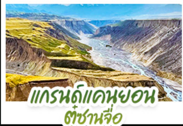
แกรนด์แคนยอน ตู้ซ่านจื่อ

ปล่อยให้หัวใจลอยไปกับสายลมเย็นบนที่ราบสูง..ในดินแดนที่ความโรแมนติก เบ่งบานท่ามกลางทุ่งหญ้าและหิมะ สัมผัสความพิศวงจึ้งของ "ทุ่งหญ้านาลาติ" และ "ทุ่งหญ้าคาลาจิน" ที่ได้รับการยกย่องว่าเป็นทุ่งหญ้าที่สวยงามที่สุดแห่งหนึ่งของโลก ชมความใสสะอาดของ "ทะเลสาบไซหลี่มู่" น้ำตกหายสุดท้ายของมหาสมุทรแอตแลนติก ที่สะท้อนเงาภูเขาหิมะอย่างงดงาม