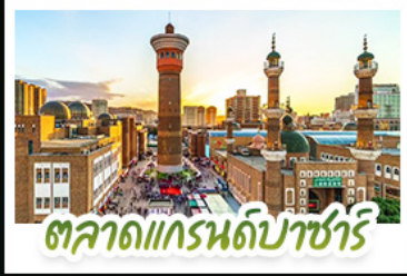
ตลาดแกรนด์ปาร์ซารี