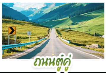
ถนนตู้คู้