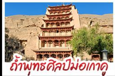
กำแพงพุทธรศิลปม่อเกาคู

เป็นทรายครวญ - สระน้ำวังพระจันทร์ ทะเลสาบเกลือฉางช่า - กำพุทธรศิลปม่อเกาคู หุบเขาสายรุ้งจางเย่ - ทะเลสาบซิงไห่