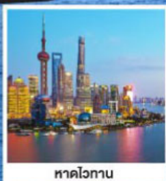
หาดโวกาน