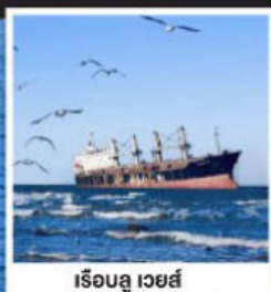
เรือซู เวย์ส์