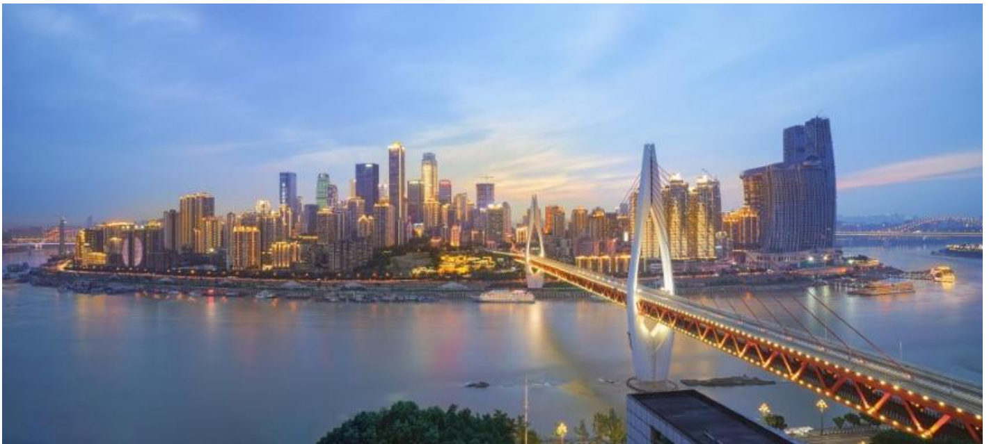
ที่พัก VIENNA HOTEL CHONGQING AIRPORT หรือเทียบเท่าระดับ 4 ดาว (มาตรฐานประเทศจีน)

23.50 น. เดินทางถึง ท่าอากาศยานนานาชาติสนามบินฉงชิ่ง เจียงเป่ย์ เมืองฉงชิ่ง "ฉงชิ่ง" มหานครที่ใหญ่ที่สุดทางภาคตะวันตกเฉียงใต้ของจีน ที่นี่ไม่ใช่แค่เมืองที่มีตึกสูงระฟ้า แต่เป็นเมืองที่เติบโตขึ้นตามแนวขุนเขาและโอบล้อมด้วยสายน้ำอย่างน่าอัศจรรย์ ได้รับสมญานามว่า "เมืองแห่งภูเขา" ฉงชิ่งคือบทพิสูจน์ของความสามารถอันน่าทึ่งของมนุษย์ในการปรับตัวและสร้างสรรค์สิ่งก่อสร้างให้กลมกลืนไปกับธรรมชาติที่ท้าทายจากนั้นนำท่านผ่านขั้นตอนตรวจคนเข้าเมือง รับกระเป๋าสัมภาระ จากนั้นนำท่านออกเดินทางเข้าสู่ที่พัก