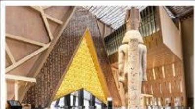
พิพิธภัณฑ์แกรนด์อียิปต์(GEM)

อารยธรรมลุ่มแม่น้ำไนล์ - พีรามิด - อเล็กซานเดรีย - เมมฟิส - ไคโร - โรงแรมระดับ 4 ดาว รวมค่าวีซ่า ตะลุยกะเลทราย - อาหารครบทุกมื้อ