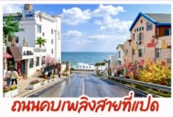
ถนนคอปเปลิงสายที่แปด