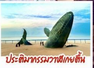
ประติมากรรมวาฬยกขึ้น