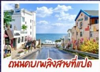
ถนนคอปเปลิงสายที่แปด