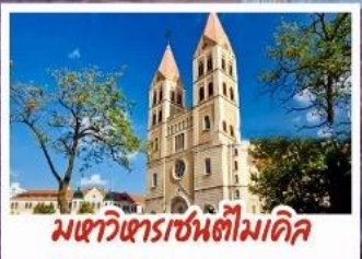
มหาวิหารเซนต์ปอล