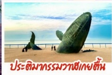
ประติมากรรมวาฬเกยตื้น