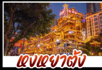
แสงอาคารต่าง

สัมผัสประสบการณ์ที่ขงจินแบบเต็มอิ่ม ทั้งความล้ำสมัยของมหานครงชิง และความงดงามตระการตาของธรรมชาติที่อู่หลง ทุกการเดินทางเต็มไปด้วยความสะดวกสบายและคุ้มค่าเกินราคา!