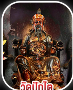
วัดปึกโต