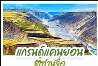
แกรนด์แคนยอน ตู้ชานเจี๋ย

ปล่อยให้ตัวเองลอยไปกับสายลมเย็นบนที่ราบสูง...ในดินแดนที่ความโรแมนติก เบ่งบานท่ามกลางทุ่งหญ้าและหิมะ สัมผัสความเขียวขจีของ "ทุ่งหญ้านาลาตี" และ "ทุ่งหญ้าคาลาจัม" ที่ได้รับการยกย่องว่าเป็นทุ่งหญ้าที่สวยงามที่สุดแห่งหนึ่งของโลก ชมความใสสะอาดของ "ทะเลสาบโซ่หิมะ" น้ำตายนสุดทาย ของมหาสมุทรแอตแลนติก ที่สะท้อนเงาภูเขาหิมะอย่างงดงาม