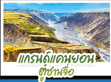
แกรนด์แคนยอน ทุ่งหญ้า

ปล่อยให้สองลอยไปกับสายลมเย็นบนที่ราบสูง..ในดินแดนที่ความโรแมนติก เบ่งบานท่ามกลางทุ่งหญ้าและหิมะ สัมผัสความพิชยวจริงของ "ทุ่งหญ้านาลาติ" และ "ทุ่งหญ้าคาลาจิน" ที่ได้รับการยกย่องว่าเป็นทุ่งหญ้าที่สวยงามที่สุดแห่งหนึ่งของโลก ชมความใสสะอาดของ "ทะเลสาบไซหลี่มู่" น้ำตกหายสุดท้ายของมหาสมุทรแอตแลนติก ที่สะท้อนเงาภูเขาหิมะอย่างงดงาม