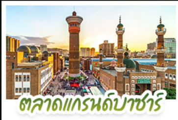
ตลาดแกรนด์ปาร์ซารี