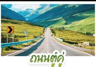
ถนนตู้คู้