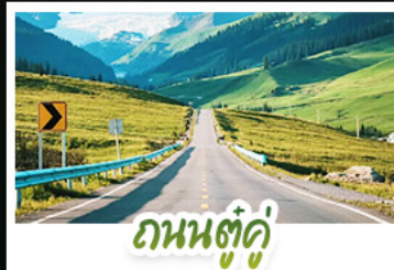
ถันตุ่คู่