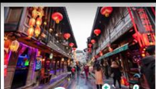
ถนนโบราณจิ้นหลี่