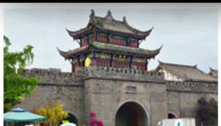
เมืองโบราณกวนเซี่ยน

ภูเขาสดุดี - อุทยานป่ฝิงโกว - สะพานหนานเฉียว - ร้านหนังสือจงซูเก้อ - เมืองโบราณกวนเสียน จตุรัสฮ้างเทียนหัว - หมีแพนด้าเซลฟี - ถนนโบราณชอยกว้างชอยแคบ - ถนนคนเดินไท่กู่หลี่ ถนนคนเดินซุนซี - ถนนโบราณจิ้นหลี่ - แพนด้ายักษ์ปิงตึก - น้ำพุไม้ไผ่ตึกSKP - วัดต้าเฉียว