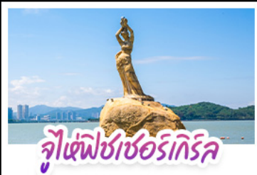
จูเซ่ฟิเชอร์อิกริก