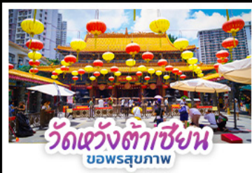
วัดแห่งต้าเซียน บ่อพรสุภภาพ