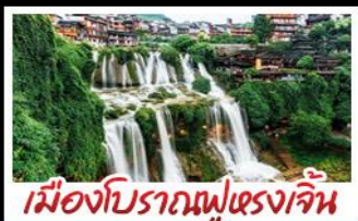
เมืองโบราณฝูเฉว่งเจิน