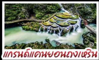
แกรนด์แคนยอนกวงเหริน

เขาฟ่านจิ่ง - เมืองโบราณฝูหรงจั้น เมืองโบราณเฟิ่งหวง - เกาะส้มจิวจี้โจว แกรนด์แคนยอนกวงเหริน - ไม้เข้าน้ำร้อนซ้อป พักโรงแรม 5 ดาว - รถไฟความเร็วสูง