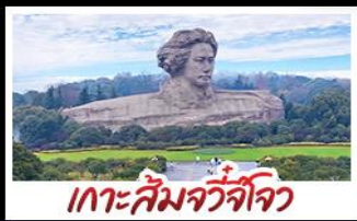
เกาะส้มจิวจี้โจว