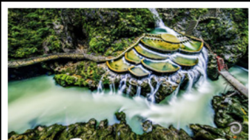
แกรนด์แคนยอนหลงเหิน

เขาฟ่านจิ้ง - เมืองโบราณฟูเหรียง เมืองโบราณเฟิ่งหวง - เกาะสัมจู้จิว แกรนด์แคนยอนหลงเหิน - ไม่เข้าร้านช้อปปิ้ง พักโรงแรม 5 ดาว - รถไฟความเร็วสูง