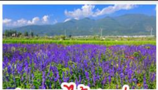
สวนดอกไม้ฮาวอวูมีฉ่าง