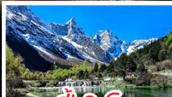
ปี่ผิงโกว