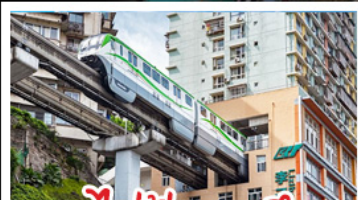
รถไฟฟ้าทะเลตุ๊ก