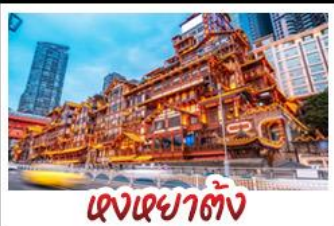
เจียงเฉยต๋อง

อุทยานหลุมบ่อฟ้า - อุทยานนางฟ้า หงหยาดัง - นั่งรถไฟทะเลสาบ - อุทยานสี่ดรุณี ปี้ผิงโกว - สะพานหนานเฉียว