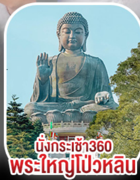
นั่งกระเช้า360 พระใหญ่ไป๋หวิน