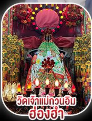
วัดเจ้าแม่กวนอิม ฮ่องฮ่า