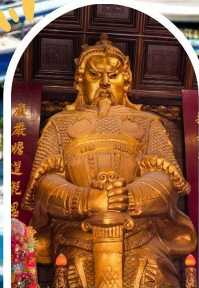
วัดแซก ขอพรโชคลาก การเงิน และธุรกิจ