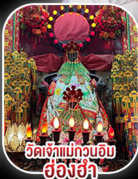
วัดเจ้าแม่กวนอิม ฮ่องฮ่า