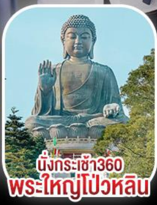
นั่งกระเช้า360 พระใหญ่ไป่หวลิน