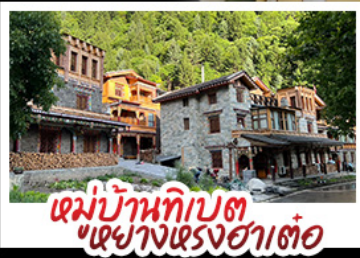
หมู่บ้านทิเบต เขางแรงฮาต๋อ