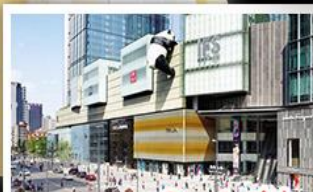
ถนนคนเดินซุนซีลู่