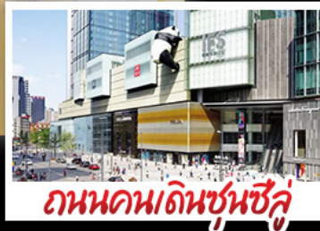
ถนนคนเดินซุนซู่