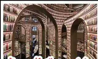
ร้านหนังสือจงซูเก้อ

อุทยานต้ากู่ปิงชวาน - อุทยานเหลียงเป่าเย่เจ้อ เมืองโบราณเฉาซียงเกว๋มฝิง - หมู่บ้านทิเบตหยางหรงฮาเต๋อ ร้านหนังสือจงซูเก้อ - หนีเพนตันอมเซลฟี พิพิธภัณฑ์ผ้าปักสววน - วัดต้าอ้อ - ถนนคนเดินซุนซีลู่ หนีเพนต้าปิงตึกIFS - ถนนไท่กู่หลี่