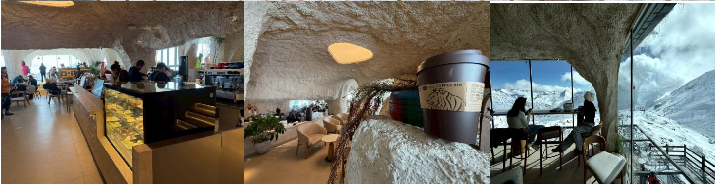
2UTFU-SL003 เชียงตุ...อาป่าโจว อุทยานเหลียนเป่าเย่เจ้อ อุทยานต้ากู่ปิงชว่น หมู่บ้านทิเบตหยางหงฮาเต้อ 5วัน 4คืน โดยสายการบิน Thai Lion Air (SL)