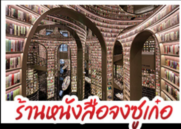
ร้านหนังสือจงซูเก้อ

อุทยานต้ากู่ปิงชาน - อุทยานเขลิ้งเป่าเซ่จ้อ เมืองโบราณเผ่าเซียงเกว่ผิง - หมู่บ้านทิเบตเขางแรงฮาต๋อ ร้านหนังสือจงซูเก้อ - หมู่บ้านออนเซ็น พิพิธภัณฑ์ผ้าปักสว่น - วัดต้าอิว - ถนนคนเดินซุนซู่ หมู่บ้านต้าปิงตักIFS - ถนนไต้กู่หลี่