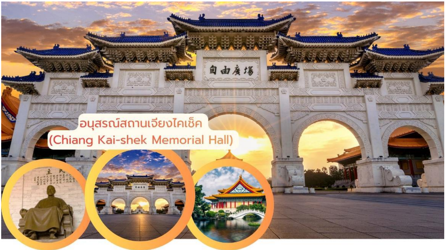
อนุสรณ์สถานเจียงไคเช็ก (Chiang Kai-shek Memorial Hall)

***หมายเหตุ: ตั้งแต่วันที่ 15 กรกฎาคม 2567 เป็นต้นไป กระทรวงวัฒนธรรมได้วันได้ประกาศยกเลิกพิธี “เปลี่ยนเวรของทหารรักษาการณ์ ที่บริเวณหน้ารูปปั้นท่านนายพลเจียงไคเช็ก ที่มีขึ้นทุก 1 ชั่วโมง บนชั้น 4 ของอนุสรณ์สถานแห่งนี้”