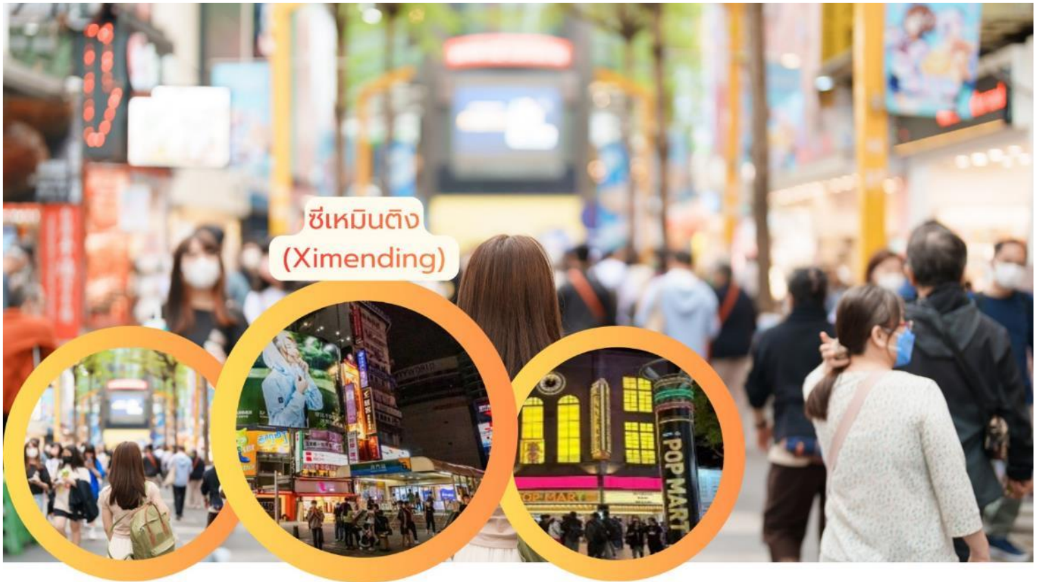
ซีเหมินติง (Ximending)