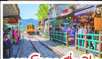
ถนนโบราณสี่กัฟ