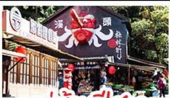
หมู่บ้านปี่ศาจ