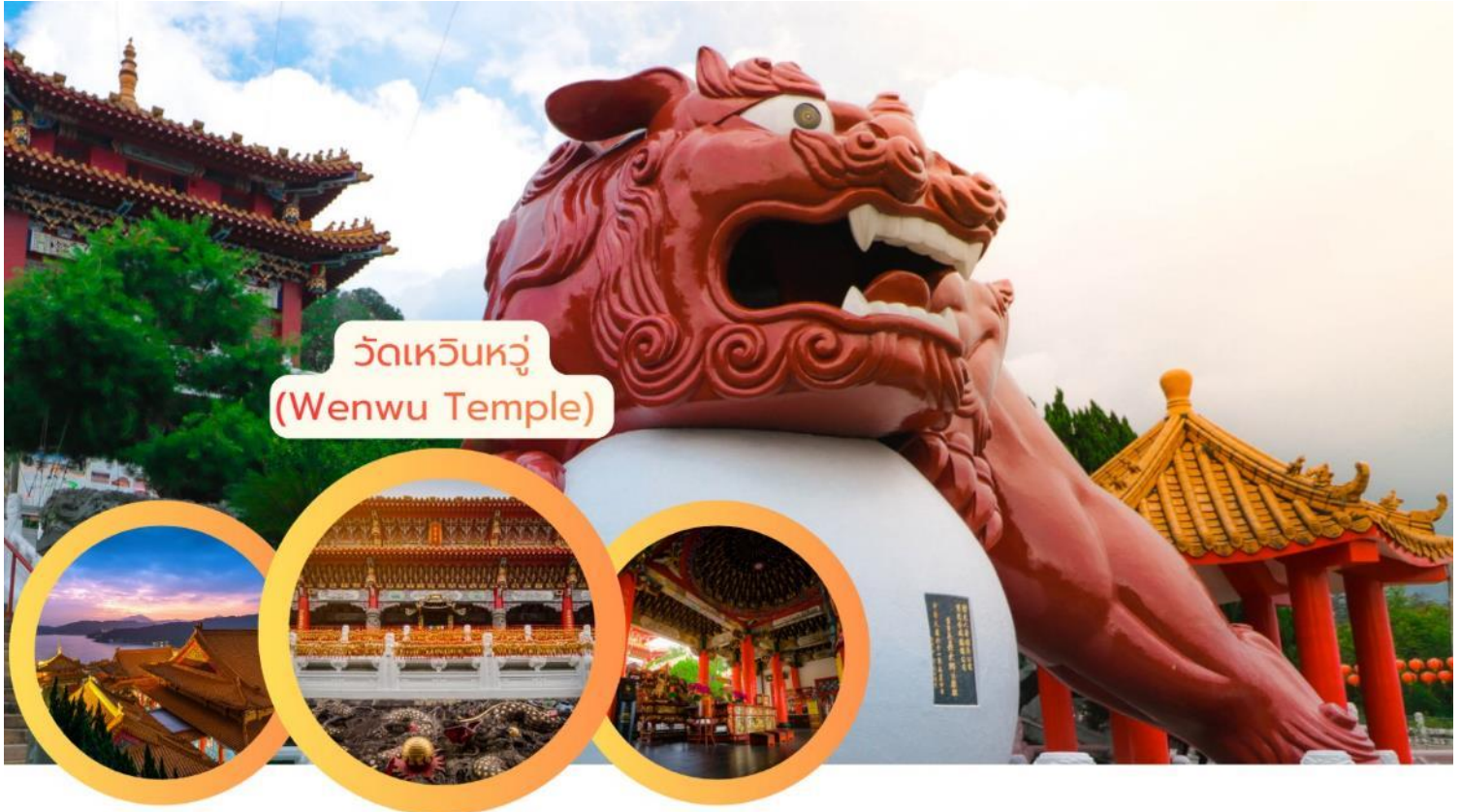
วัดเหวินหวู่ (Wenwu Temple)

นำท่าน ล่องเรือทะเลสาบสุริยันจันทรา (Sun Moon Lake Boat Trip) กิจกรรมห้ามพลาดเพื่อชมทัศนียภาพของทะเลสาบน้ำจืดที่ใหญ่ที่สุดในไต้หวัน ระหว่างล่องเรือชมทะเลสาบสุริยันจันทรา ท่านจะได้สัมผัสและเพลิดเพลินกับวิวภูเขาสลับซับซ้อน น้ำใสสะอาด และบรรยากาศเงียบสงบรอบทะเลสาบ โดยเรือท่องเที่ยวจะพาท่านชม เกาะกลางทะเลสาบ วัดริมฝั่ง และทิวทัศน์ธรรมชาติที่เปลี่ยนไปตามฤดูกาล ทุกช่วงเวลาเหมาะกับการถ่ายภาพและพักผ่อนจิตใจ Sun Moon Lake ตั้งอยู่ในเมืองหนานโถว ไต้หวัน เป็นทะเลสาบที่มีชื่อเสียงทั้งด้าน ความงดงามทางธรรมชาติและคุณค่าทางวัฒนธรรม ด้วยรูปร่างของทะเลสาบที่คล้ายพระอาทิตย์และพระจันทร์ สถานที่แห่งนี้จึงมีความสำคัญทั้งในเชิงสัญลักษณ์และศาสนา