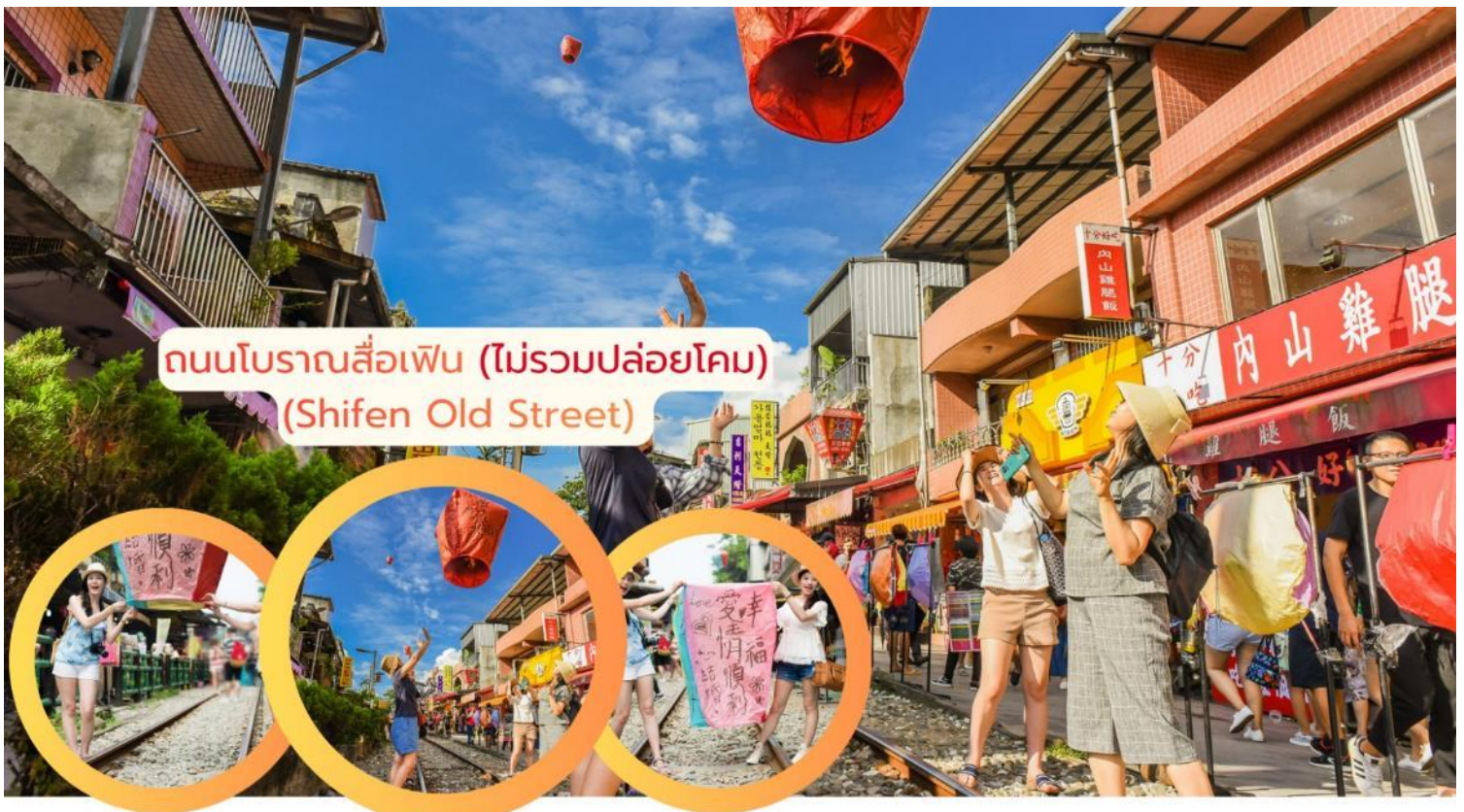
ถนนโบราณสี่เฟิน (ไม่รวมปล่อยโคม) (Shifen Old Street)

เดินทางสู่ เมืองนิวไทเป จากนั้นพาท่านเดินทอดน่องบนทางรถไฟสายประวัติศาสตร์ที่ยังมีชีวิต ถนนโบราณสี่เฟิน (Shifen Old Street) (ไม่รวมปล่อยโคม) สัมผัสเสน่ห์ที่ไม่เหมือนใครของหมู่บ้านโบราณที่มีทางรถไฟพาดผ่านหน้าบ้านเพียงไม่กี่ก้าว บันทึกภาพความประทับใจยามขบวนรถไฟสีสันสดใสเคลื่อนตัวผ่านย่านเก่าอันอบอุ่น พิกัดสุดวินเทจที่สายถ่ายรูปและคนรักรถไฟต้องหลงรัก ท่านสามารถปล่อยโดมลอยและเขียนคำอธิษฐานลงบนโดมสีสันสดใส แล้วปล่อยให้ลอยล่องไปเหนือทางรถไฟสายประวัติศาสตร์ ท่ามกลางหุบเขาและมิตรภาพที่อบอุ่น วินาทีที่โคมทะยานสู่ท้องฟ้า คือช่วงเวลาแห่งความหวังและความทรงจำที่สวยงามที่สุดครั้งหนึ่งในชีวิต"(ไม่รวมปล่อยโคม)