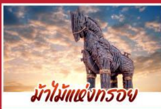
ม้าไม้แห่งทรอย