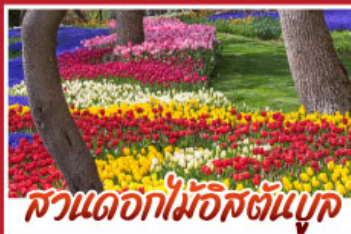
สวนดอกไม้อิสตันบูล