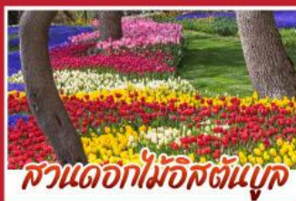
สวนดอกไม้อิสตันบูล