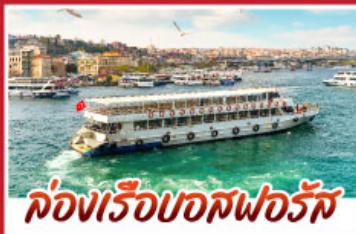
ล่องเรือบอสฟอรัส