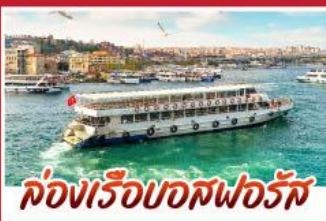
ค่องเรือบอสฟอรัส