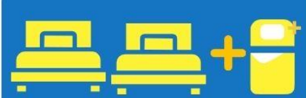
เตียง 3 ท่าน ที่นอนเสริม TRIPLE