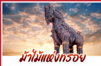
ม้าไม้แห่งทรอย