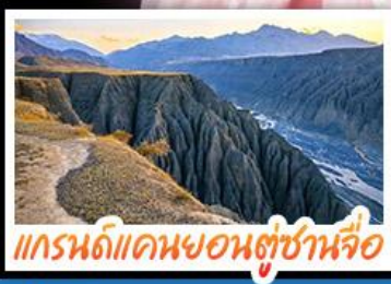
แกรนด์แคนยอนตู่ชานจื่อ