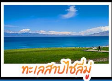
ทะเลสาบไซลี่มู

หุบเขาดอกท้อ - ทะเลสาบไซลี่มู แกรนด์แคนยอนตู่ชานจื่อ - ทุ่งหญ้านาดาลี