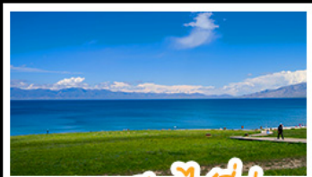
ทะเลสาบไซลีมู

หุบเขาดอกท้อ - ทะเลสาบไซลีมู แกรนด์แคนยอนคู่ชานจื่อ - ทุ่งหญ้านาลาตี