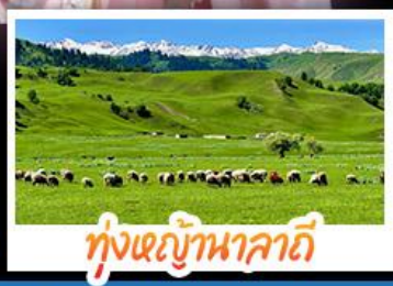
ทุ่งหญ้านาดาลี